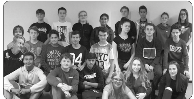
Roboter – los. Schüler/-innen der Sekundarschule Bäumlihof gestalten Roboter